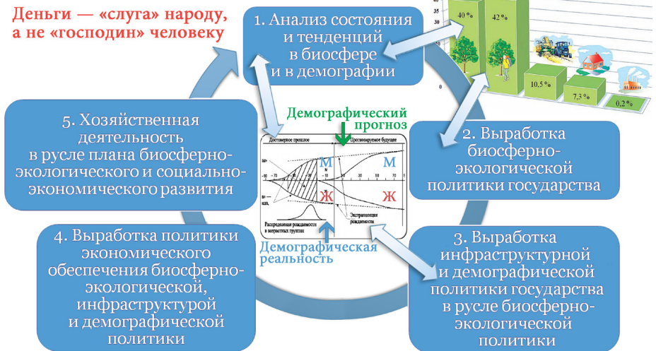
Рис.1 — Взаимная обусловленность частных управленческих задач в ходе реализации концепции устойчивого развития